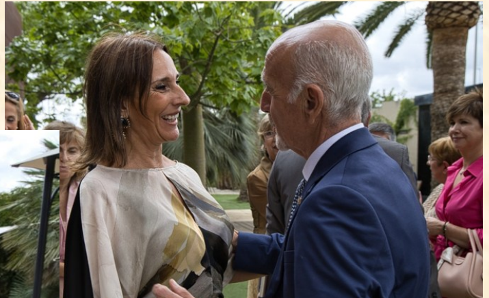
Directora Provincial de la Tesorería General de la Seguridad Social