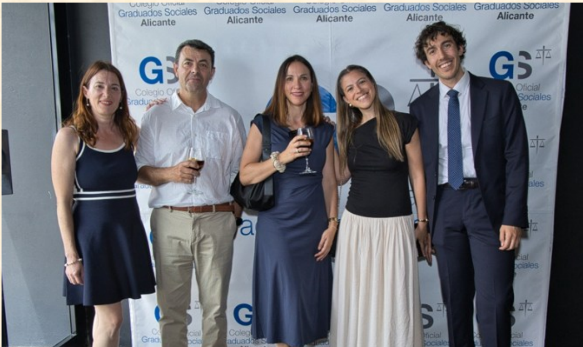
Profesores Colaboradores del Curso Procesal Laboral del Colegio y Juez de Adscripción territorial en Alicante del Juzgado de lo Contencioso- Administrativo nº 2 de Elche, Jueza de Adscripción territorial en Alicante del Juzgado de lo