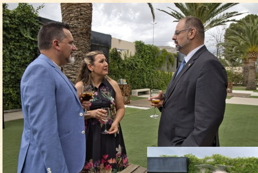
Decano y miembros de la Junta de Gobierno del Colegio Oficial de Detectives Privados de la Co- munidad Valenciana