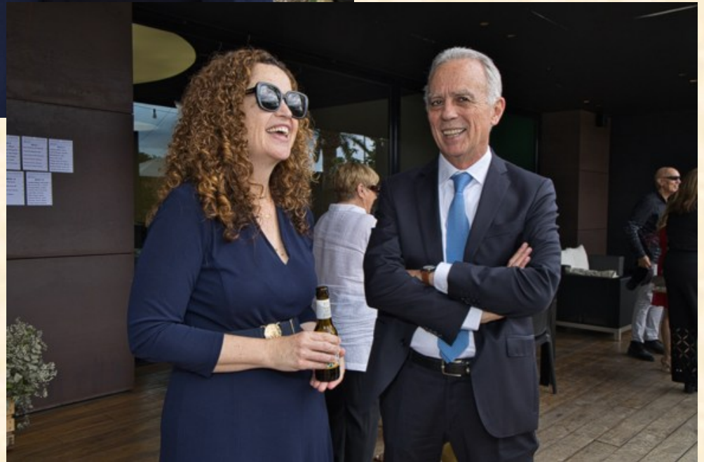
Secretaria Coordinadora Provincial de Alicante