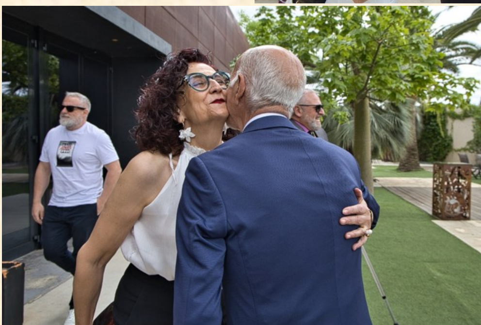
Presidenta de Honor del Excmo. Colegio Oficial de Graduados Sociales de Alicante