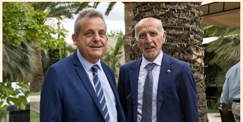
Miembros de la Junta de Gobierno del Excmo. Colegio Oficial de Graduados Sociales de Alicante