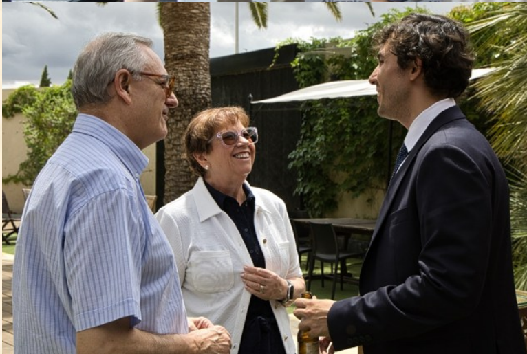
Social nº 3 de Elche y Directora Adjunta del Servicio de Tramitación del Tribunal de Instancia de Elche