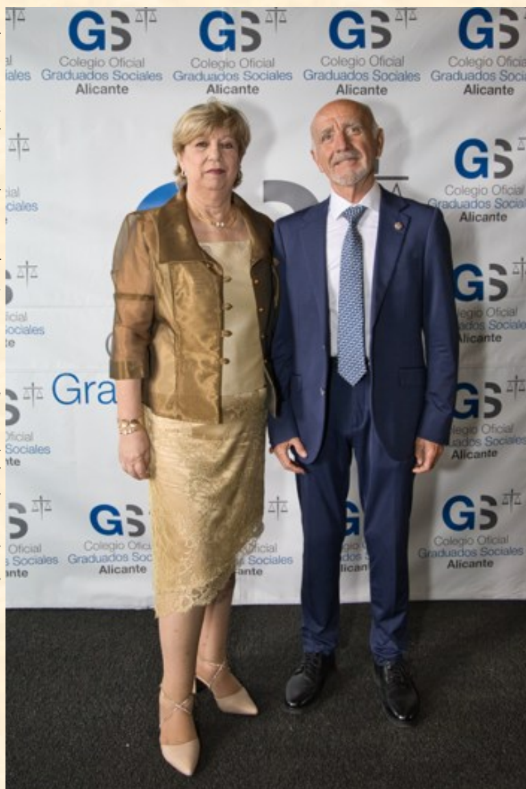
Presidente del Excmo. Colegio Oficial de Graduados Sociales de Alicante