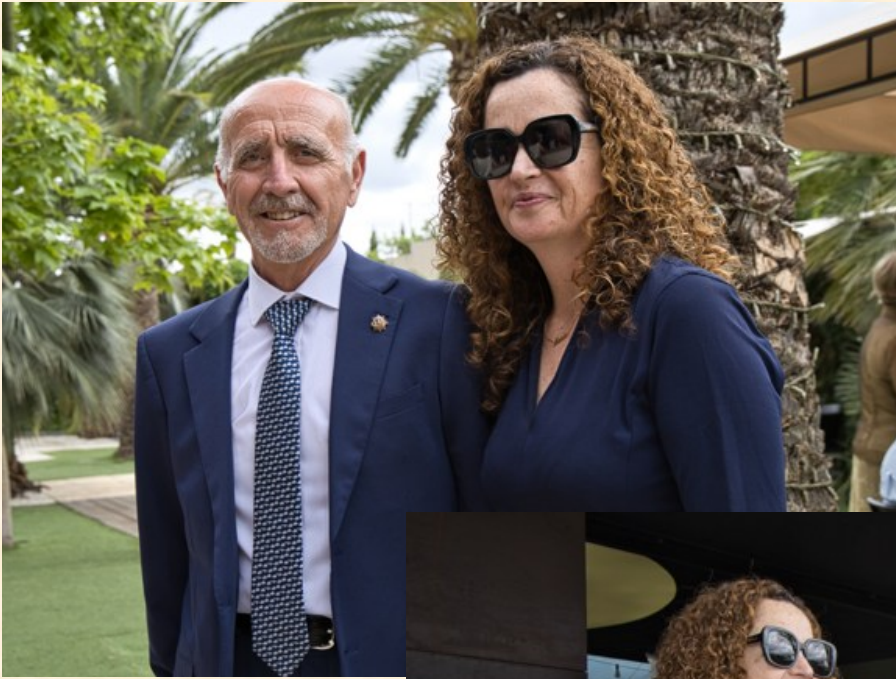
Directora General de Trabajo, Cooperativismo y Seguridad Laboral