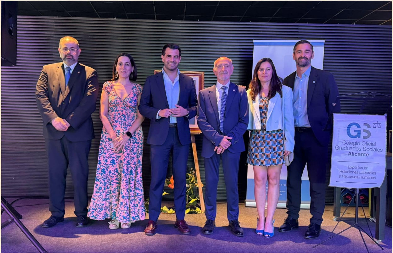
Director General de Atención a las Víctimas y Acceso a la Justicia, Presidenta y Vocal del Colegio Oficial de Trabajo Social de Alicante, Decano de la Junta de Gobierno del Colegio Oficial de Detectives Privados de la Comunidad Valenciana y Director de Caja Ingenieros Alicante